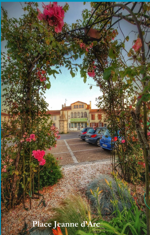
Place Jeanne d'Arc