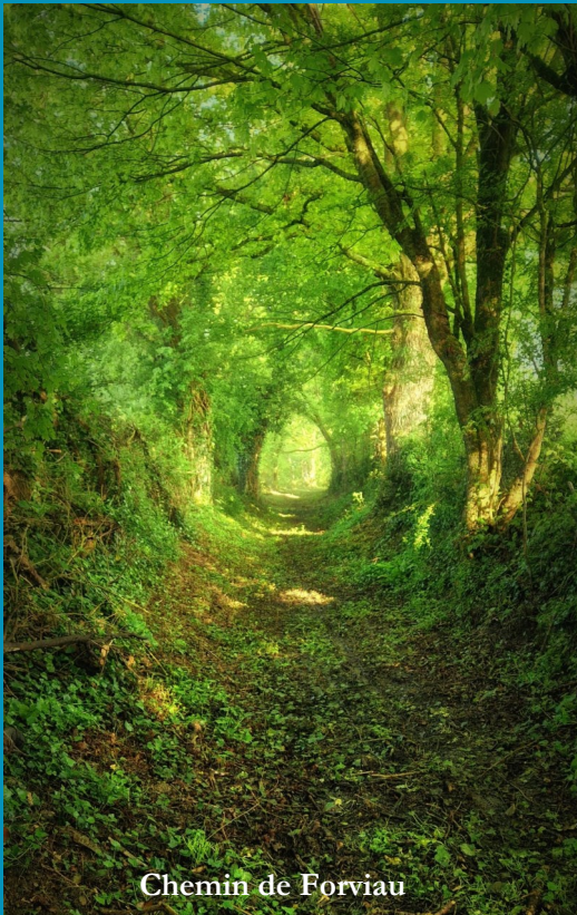
Chemin de Forviau